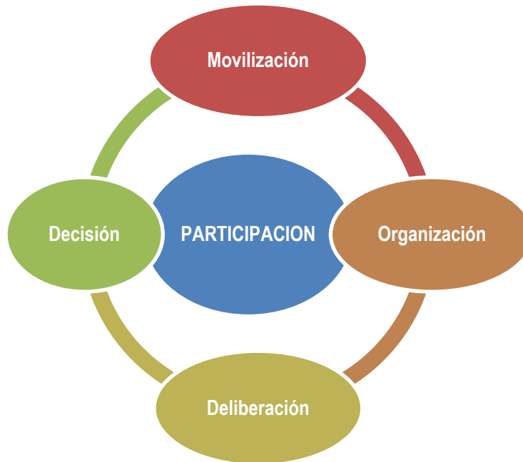
Gráfico N° 2 Lineamientos para la participación 3 .